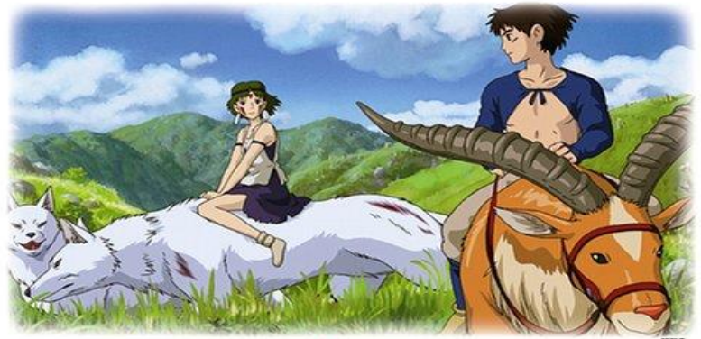
スタジオジブリ もののけ姫

「もののけ姫・サン」は山犬に育てられたにも拘らず、人の言葉を話して物語は展開しています。山犬に育てられた人間が言葉をしゃべるはずはないのですが・・・。