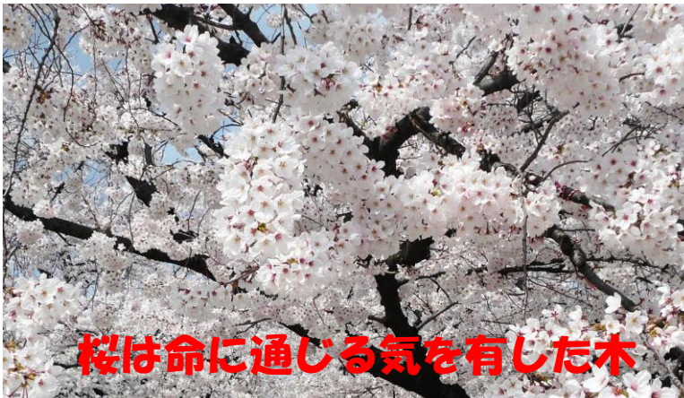
桜は命に通じる気を有した木

春爛漫、桜の花を見ると日本人に限らず外国人も大きな喜びと幸福感に満たされるようです。不思議と思いませんか？数ある花々の中で桜の木だけが持つ強烈で不思議なパワー……。『桜』を字割すると図解のように「命に通じる基の気」であると解せます。それ故に人は皆桜の花を好み、そこから大いなる命の力を受けている……。ようです。