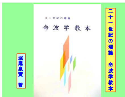
堀尾泉實著 2500円+送料