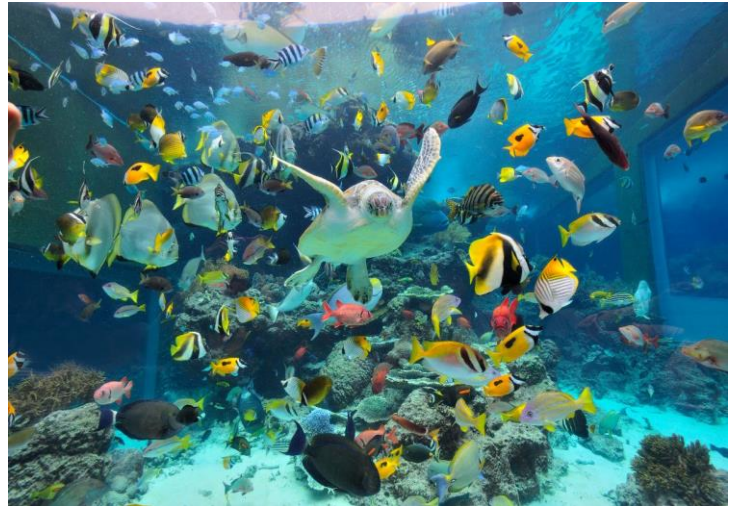
宇宙を海に喩えると現代科学は魚や海藻を宇宙と捉えている

万物を生み出し懐胎しているその真空の透明な世界そのものを無視している。そこに大きな間違