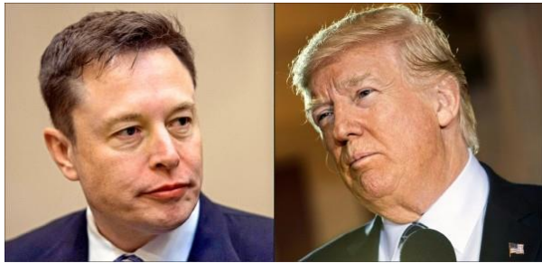
トランプ大統領 (右) とイーロン・マスク

1月20日、彼は「アメリカン・ファースト」を掲げて大統領に就任すると同時に、DSが進めていたコロナワクチンによる人口削減を推進してきた「WHO からの脱退」と、地球環境保持の美名の裏で世界各国を一段と締め付ける「パリ条約から脱退」する大統領令を発令しました。